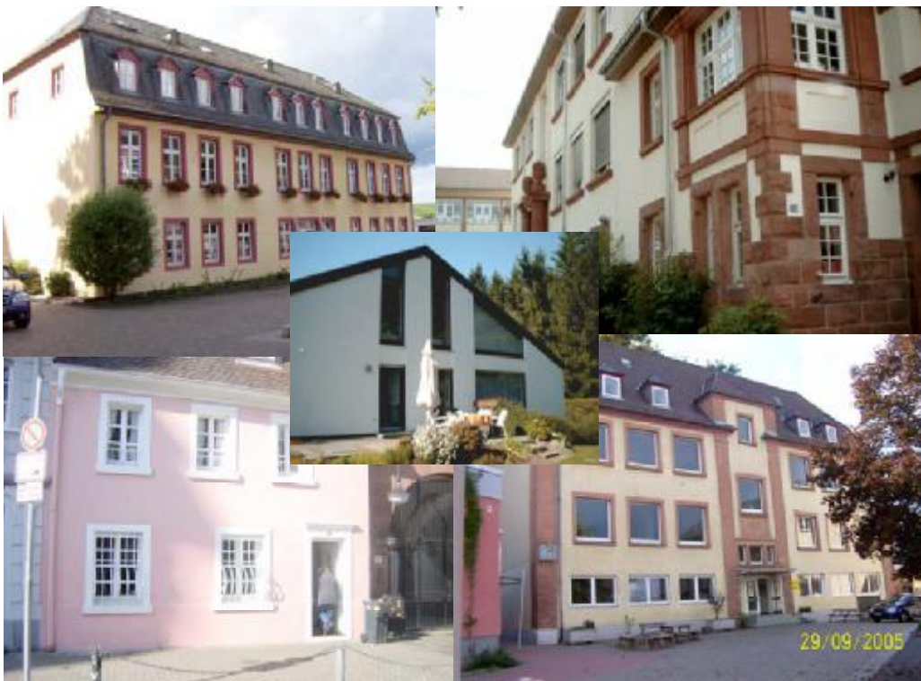
Bodenheim Schule Oberschopfheim Urban Dahn Waller Saarbrücken Grundschule Bodenheim

3 CM Messung: durch Entnahme einer Mauerprobe, die abgewogen in eine Druckflasche mit einer Karbid-Kapsel gefüllt wird. Durch Schütteln der Druckflasche entwickelt sich Azethylen gas. Das auf der Druckflasche aufgesetzten Manometer zeigt einen entsprechenden Druck an. Dieser Wert führt über eine Tabelle zu der prozentualen Feuchtigkeit im Mauerwerk.